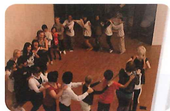
歓迎交流会ではダンスで交流