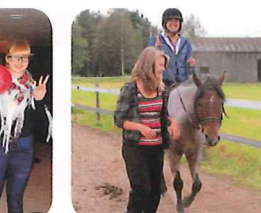
ホストと乗馬体験