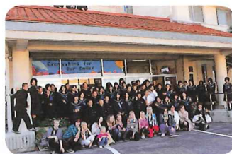
地元中学生との交流