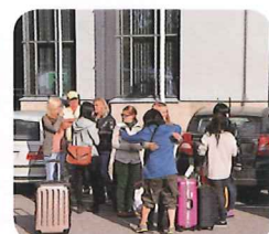
8/24 ホストと涙の別れ