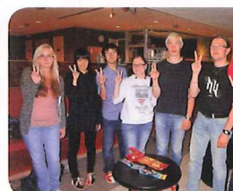
現地高校生との交流