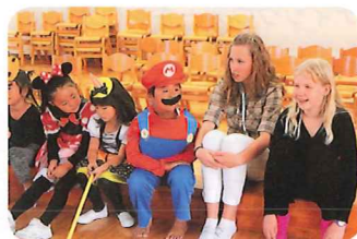
幼稚園でハロウィンゲームに参加