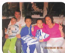
1週間のホームステイ