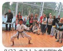
8/23 ホストとのお別れ会 空手など団員特技披露