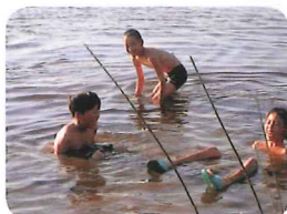
8/20 コテージで歓迎交流会 フィンランドサウナ体験