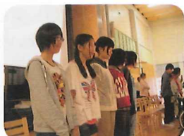
8/20 小学校にて歓迎会 日本文化紹介の出し物披露