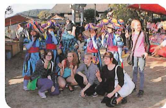
地域の秋祭を楽しむ