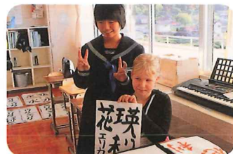
書道体験を楽しむ。漢字の名前に挑戦