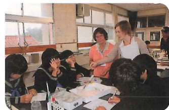
団長の化学教諭は授業体験を行う