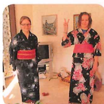
ホストに浴衣着付け