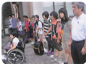
8/15 不安と期待を胸に出発