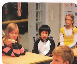
ホストの生徒と授業体験