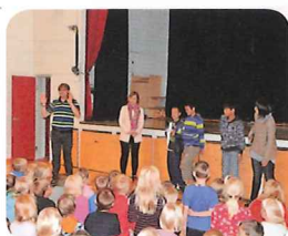
8/22 小中一貫校にて歓迎会