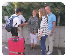
8/17 カラヨキ市到着 ホストファミリーと対面